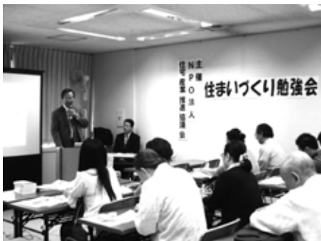
前回横浜市中区での勉強会の様子